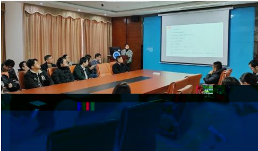
图 员工专业技能培训

，公 促 发 和 才 方 得 成 。 过 创 的 和 ， 不 动 公 的 持 成长， 工 供 的发 机会。 过 供多 化的 和发 ， “ 队 共 ” 等 活动 ( )， 帮 工 ( 技 和管 ； 并 的 和 规划， 工的 合 和 ， 包 导 发 计划、技 技 及 部 等， 地促 工的 方 发 。