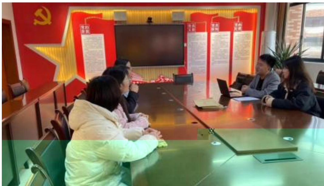
图 校企开展学术研讨项目交流会议

公 高度 队 的 ，充分 到 和 的关 ，对 高 和 关 的 。此公 供 ，包 更 、 方法 及 导 发 程，并 持 丰富 的 家 过 、 会 和 际案 ， 队 分 的 和 。 常 地 活动， 包 参加 会 、 等 ， 促 回 的 分 ， ， 并 的 队 ( )。