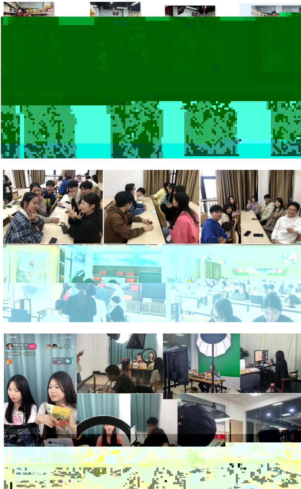
图 组织学生开展实习实训