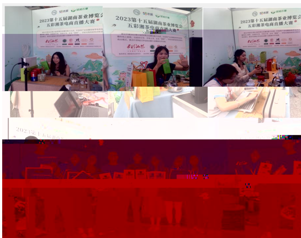
图 “湖南省第十五届茶博会” 电商直播比赛现场

播和方的，短 得的步。 队比10多单、单， 包但不、等多个的 和队得的高度。的 得不对公的，更对参 付出和的充分定。