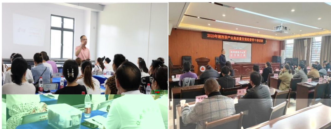
图 企业协助学校为湘西茶企开展电商直播培训

更 对 电 的 。 过 的 ， 茶 得 更 地 电 播的操 、 策 等方 的 ， 电 的 奠定 础。